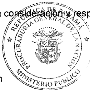
Kenia I. Porcell D. Procuradora General de la Nación

Del Honorable Diputado, con toda consideración y respeto.